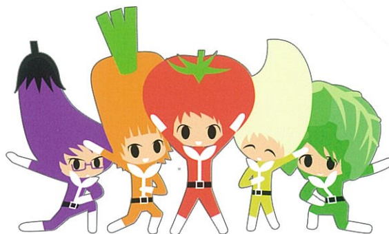
イメージキャラクター「ファームレンジャー」