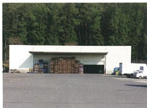
中信集荷センター